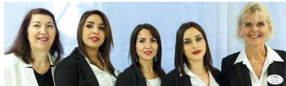
Notre équipe administrative