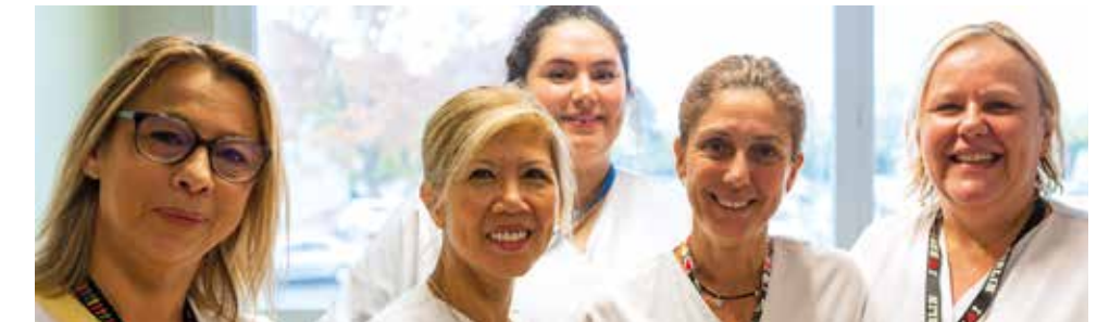
Notre équipe hôtelière

Ainsi, notre équipe pluridisciplinaire veille au mieux-être psychologique et physique de nos patients grâce à la qualité du cadre de vie.