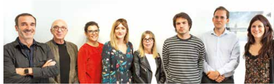
Notre équipe de Médecins Psychiatres

La Clinique assure une prise en charge en hospitalisation complète, en ambulatoire grâce à son Hôpital de jour ainsi qu'une offre en consultations, notamment grâce à son unité de consultations réactives, et est spécialisée dans le traitement psychothérapeutique des :